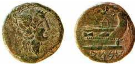
Fig. 4A. As de Arse , Ripollès 2002, 195 (cat.271b).