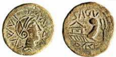
Fig. 4C. As de Arse/Sagunto , Ripollès 2002, 74 (cat.383a).

Arse debió jugar un papel clave en la logística romana en la Península Ibérica por su posición de enlace entre la costa y el interior. Desde la Segunda Guerra Púnica, la ciudad que será conocida más tarde con el nombre de Sagunto, y que aún se llama Arse , aparece amenazada y en contacto estrecho con poblaciones del interior, como es el caso de los famosos turboletas, probablemente una población celtibérica 86 . De hecho, la primera referencia clara a la Celtiberia de un autor greco-romano se sitúa en el contexto de la Segunda Guerra Púnica, al narrar Polibio el asedio de Sagunto 87 . Desde entonces los celtíberos aparecen como consistentes aliados de los ejércitos romanos en Iberia, aunque no siempre proporcionando el soporte militar requerido 88 . Los celtíberos, además, aparecen siempre próximos al sur del río Ebro. Así, cuando se produce una penetración romana desde el Levante hacia el interior, la ruta preferida es la que, partiendo desde Sagunto o sus inmediaciones, continua por el centro de la Península y remonta hasta el valle medio y alto del Ebro. Por su parte, el río más caudaloso de Hispania no parece haberse constituido en la ruta romana más practicada, no al menos en toda su longitud, y no desde su desembocadura.