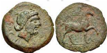
Fig. 2A. AE de Salaci . Classical Numismatic Group, Electronic Auction 219, Auction date: 30 Septembre 2009, Lot number 150.

F. Chaves y A. J. Domínguez Monedero tienen razón a nuestro juicio en atribuir las acuñaciones de Sacili a fuerzas númidas en la Península Ibérica, y no solamente a un mundo vagamente “púnico” o “norteafricano”. De hecho, el caballo parado a la derecha y asociado a leyendas en “neopúnico” (libio-fenicio) 30 es típico de ciertas amonedaciones númidas. Además, las ciudades reales númidas de Siga y de Cirta suelen figurar en las series monetarias acuñadas en tiempos de Massinissa (203-148 a.C.) 31 , o Micipsa (148-118 a.C.) (fig. 2B), con el caballo al paso, exactamente de la misma manera en como aparece en Sacili 32 . Apiano 33 señala como Yugurtha se movió desde África hacia Numancia en el año 134 a.C.