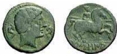
Fig 1A. As de Tamusia , ca. 100 a.C.

Tamusia es la leyenda de exergo escrita en caracteres ibéricos sobre las monedas de bronce descubiertas en Villasviejas de Tamuja (Botija, Cáceres) (fig.1 A, 1C). La tipología de estas monedas de bronce, anverso y reverso (busto desnudo/lancero a caballo), es completamente celtibérica y especialmente próxima a algunas cecas del este de la Celtiberia