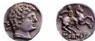
Fig. 3B. Denario de Sekobirikes .