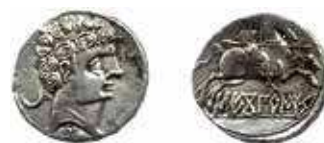
Fig. 3A. Denario de Sekaisa .

Del mismo modo que existe una clara dicotomía entre las monedas de una Sekaisa situada en algún punto de la Celtiberia y unas monedas de Sekobirikes distribuidas en el alto valle del Duero, así también las monedas de Arekorata (fig. 3C), descubiertas fundamentalmente en el alto valle del Duero no tienen por qué corresponderse forzosamente con una ciudad situada en estas latitudes. En la famosa tessera de hospitalidad de Luzaga, gentes de Arekorata aparecen nombradas como muy próximas