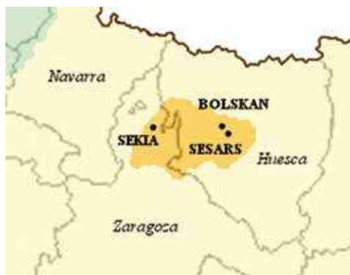
Fig. 3F. Ciudades de Bolskan , Sesars y Sekia .