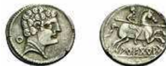
Fig. 3C. Denario de Arekorata .