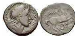
Fig. 2D. AE. Salapia (Italia). 216-210 a.C. Classical Numismatic Group, Electronic Auction 215, Auction date: 29 July 2009, Lot number 8.