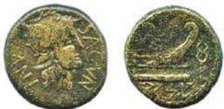
Fig. 4B. As de Arse/Sagunto , imagen extraída de la página web http://moneda-hispanica.com/iberia.htm .