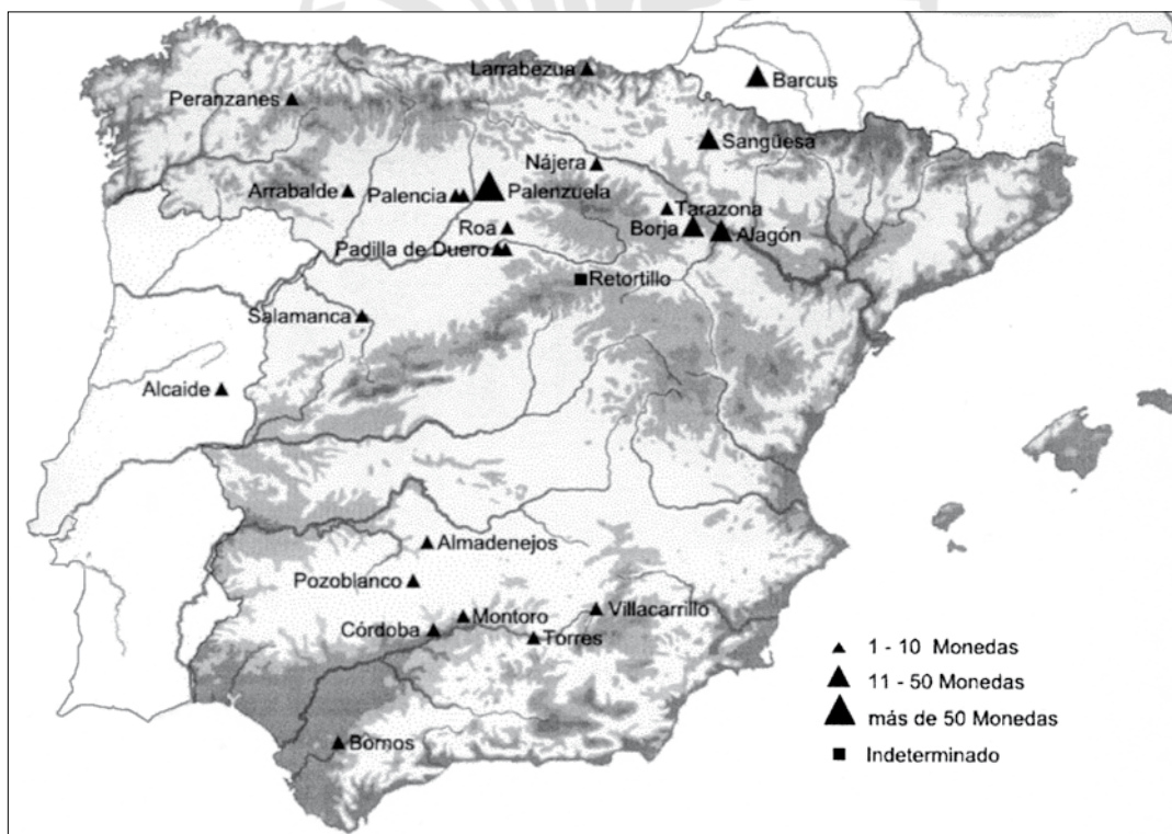
Fig. 4E. Mapa con tesosillos conteniendo moneda de Arsaos , Fernández Gómez 2009, 358, fig. 3.

Calagurris , además, aparece ligada en sus primeras emisiones monetales a ( P. Cornelius Scipio ) Nassica , y esto se debió probablemente al simple hecho de que fue este comandante romano quien (re)fundó esta ciudad hacia el año 94/3 a.C. 108 . A este respecto, puede señalarse que las monedas de la ceca de Arsaos 109 , taller que se cuenta entre los más importantes del norte de la Celtiberia, se localizan especialmente entre el alto valle del Ebro, la Bética y la Meseta, con su mayor pico representativo en torno a Pallantia (Palenzuela 110 ) (fig. 4. E) 111 . Y es que, como Turiasu 112 , Arsaos parece haber sostenido el peso de las actividades logísticas celtibéricas que narran las fuentes en torno a