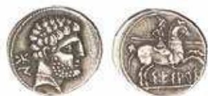
Fig. 3E. Denario de Sesars .