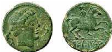
Fig 1B. As de Sekaisa , ca. 100 a.C..