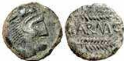
Fig. 2G. As de Carmo : ¿guarnición gaditana?