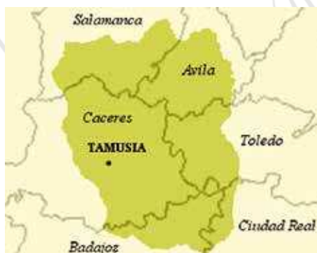
Fig 1C. Ciudad de Tamusia .