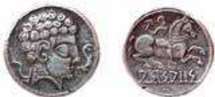
Fig. 4D. Denario de Arsaos , imagen extraída de la página web http://moneda-hispanica.com/iberia.htm .

Saguntum es un nombre que tiene todo en común con Segeda y Segóbriga, y esto se debe a que ambas ciudades corrieron historias paralelas en su relación con Roma. Además, debe entenderse que los acontecimientos bélicos en el levante hispano, la Celtiberia y el alto valle del Ebro estuvieron siempre interconectados. A este respecto, J. Untermann señala que el único parecido toponímico serio existente en Hispania con Arse es el de Arsaos 106 (fig. 4D), asentamiento no localizado con precisión, pero probablemente cercano o idéntico a Calagurris . Esta fue precisamente la ciudad del valle del Ebro de mayor importancia en época julio-claudia, sólo inferior en rango a Caesaraugusta . Es desde ella también, o en todo caso desde sus cercanías, desde donde debe entenderse que se emprendieron las grandes operaciones militares romano-indígenas hacia tierras vacceas, cántabras y béticas 107 .