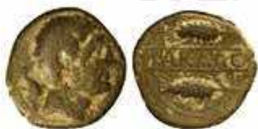
Fig. 2E. As de Carmo con delfín.

Sin duda el papel desempeñado por grupos expedicionarios celtíberos en movimiento en la Península Ibérica ha sido muy subestimado o confundido con migraciones, deportaciones y colonizaciones agrarias varias. Sin embargo, el registro arqueológico, tanto como la evidencia monetaria, textual, e incluso epigráfica, no hacen sino señalarlos su existencia 46 . Junto con otro tipo de tropas romanas, gaditanas o númidas, fuerzas celtíberas fueron también acantonadas como guarniciones en no pocos campamentos y ciudades establecidas por toda Hispania. De entre los construidos ex profeso para albergar uexillationes en su interior, Tamusia constituye un buen ejemplo. De entre las ciudades que se prestaron a albergar soldados tras sus muros, Carmo debió ser una de las principales.