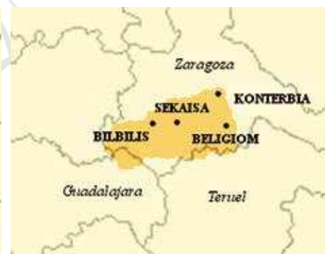
Fig 1D. Ciudad de Sekaisa . Imágenes extraídas de la página web http://moneda-hispanica.com/iberia.htm