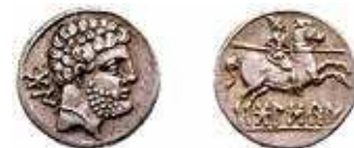
Fig. 3G. Denario de Bolskan .