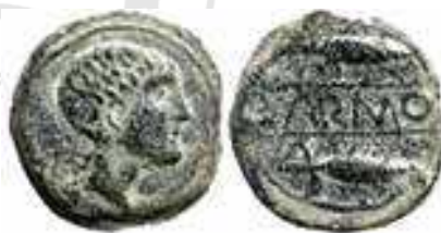
Fig. 2F. As de Carmo sin delfín, pero con estilo derivado del anterior tipo: ¿guarnición celtibérica?