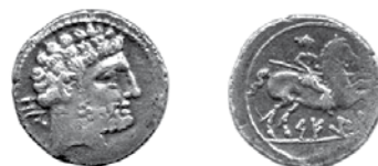
Fig. 3H. Denario de Sekia .