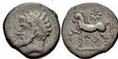
Fig. 2B. AE de Massinissa o Micipsa (203-148 a.C. o 148-118 a.C.). Siga ; Classical Numismatic Group, Electronic Auction 219, Auction date: 30 September 2009, Lot numbers 312.