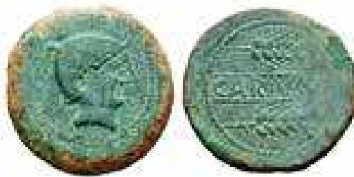
Fig. 2H. As de Carmo con busto con casco: ¿guarnición bética?