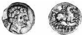
Fig. 3D. Denario de Oilaunes . Imagen extraída de la página web http://moneda-hispánica.com/iberia.htm .

Oilaunes , Oilaunikos y Oilaunu y el epíteto Lenus aplicado a Marte en este tipo de promontorios llamados “ Ocelus ” u “ Ocilis ” 69 . En todo caso, nos parece posible asimilar los denarios con rótulo celtibérico Oilaunu 70 con Ocilis , la plaza fuerte por excelencia de Nertóbriga/ Arecorata en Apiano. Los denarios Oilaunu (fig. 3D) presentan enormes analogías con los denarios de Arecorata 71 , detalle que no ha sido ignorado por los más avezados numismatas 72 . El busto en el anverso de ambas cecas es juvenil e imberbe. En las dos se ajusta también al cuello un torques en forma de media luna descendente. El cabello es rizado y conformado en los dos casos por seis medios óvalos dispuestos en una triple anulación concéntrica. La mandíbula, la nariz y el mentón se dibujan en los dos bustos a partir de trazos marcadamente rectilíneos. El caballo de los reversos, además, se crea en los dos casos a partir de un potente cuerpo central, siendo los cuartos