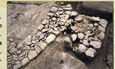
Muralla y bastión cuadrangular adosado

En una sociedad en conflicto, como la de época celtibérica, un poblado asentado en llano, como "Las Eretas", necesitaba construir un sistema defensivo, en este caso con muralla jalonda de torreones.