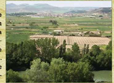
Vista de Berbinzana rodeada por el río Arga

El poblado de "Las Eretas" se sitúa en Berbinzana. Era una aldea donde vivía una pequeña comunidad campesina que cultivaba las riberas del río Arga, de alta productividad cerealista. Surgida en el siglo VII a.C., se destruyó en el s. V a.C. y pervivió hasta el s. I a.C.