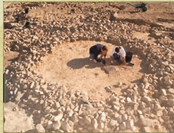
Túmulo en fase de excavación

Las excavaciones de la necrópolis de "El Castillo" descubrieron más de un centenar de enterramientos. Los túmulos circulares contienen cistas con urnas, con los huesos cremados del difunto.