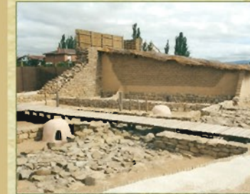
Reconstrucción de las viviendas de adobes

Las viviendas, de planta rectangular, se construían con adobes y se adosaban a la muralla de piedra. En cada vivienda se ha encontrado abundante cerámica: vasijas contenedoras de cereal, ollas para cocinar, vasos para beber y platos para comer.