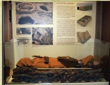
Detalle de la exposición sobre la Edad del Hierro

De la Primera Edad del Hierro son las reconstrucciones de tumbas de la necrópolis de "El Castillo" del 500 a.C. y las vitrinas con los ajuares más representativos.