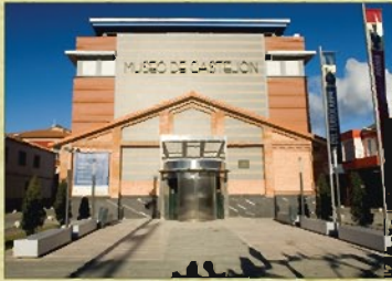
Vista del edificio del Museo de Castejón