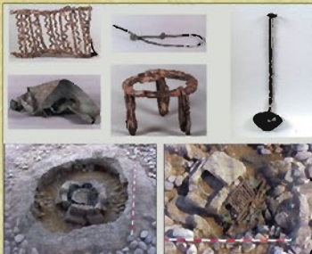
Elementos del banquete funerario y tumbas donde se localizaron

Dos de los túmulos de mayores dimensiones presentan ajuares excepcionales. La parrilla y espetón para asar carne y el caldero y el cazo para escanciar vino, ritual de banquete de una élite guerrera.