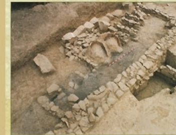
Obrador con hornos y bases de granero de madera

En una de las esquinas del poblado se ha descubierto un obrador de carácter comunitario. Los muretes de piedra soportarían unas tablas, base de un posible granero de madera. En los dos hornos anexos se cocería el pan.