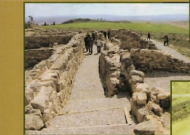
16. Alto Chacón