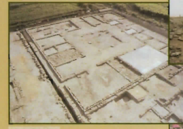
14. La Caridad