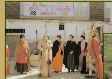
Recreación de trajes celtibéricos. Segeda

La Rioja: 38.- Contrebia Leukade y Centro de Interpretación. Aguilar del Río Alhama. Navarra: 39.- Museo municipal. Castejón.