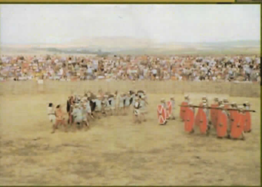
Representacion histórica. Numancia