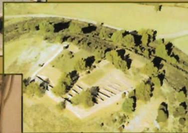
30. El Cerameño