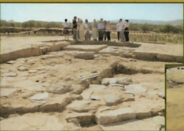
11. Segeda I